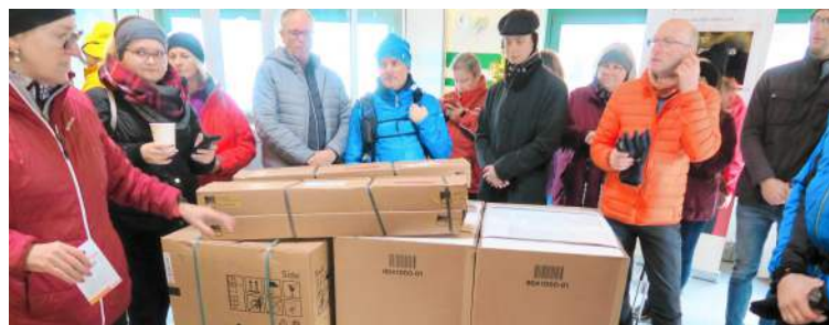
▲ Verteilung der Geschenke im Vorjahr.